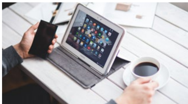
a képek csak illusztrációk

3 db HB típusú hőszivattyús forróvíztároló (tetszőleges összetételben HB 200, 200 C, vagy 300, 300C, 300C1-es) értékesítéséért a HAJDU Zrt. egy tablettel jutalmazza partnerei üzleti dolgozóit.